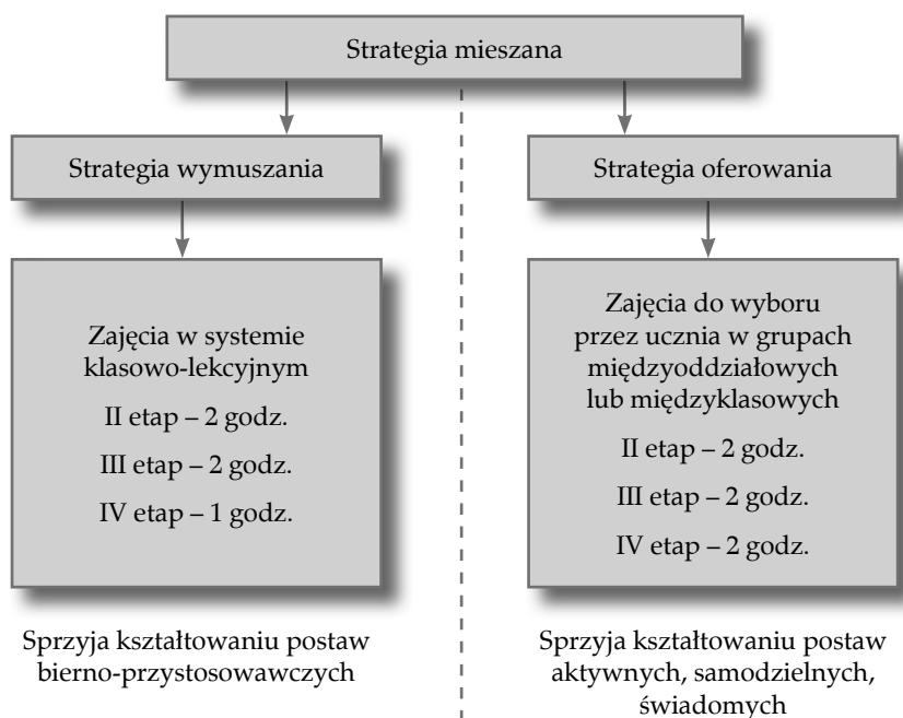
Rys. 1. Proponowany model organizacyjny wychowania fizycznego

Zgodnie z obowiązującymi regulacjami prawnymi, wychowanie fizyczne może być realizowane dwutorowo, czyli w oparciu o „strategię mieszaną”, łączącą „strategię wymuszania” (obowiązkowe zajęcia w systemie klasowo-lekcyjnym takie same dla wszystkich uczniów) ze „strategią oferowania” (obowiązkowe zajęcia do indywidualnego wyboru przez ucznia).